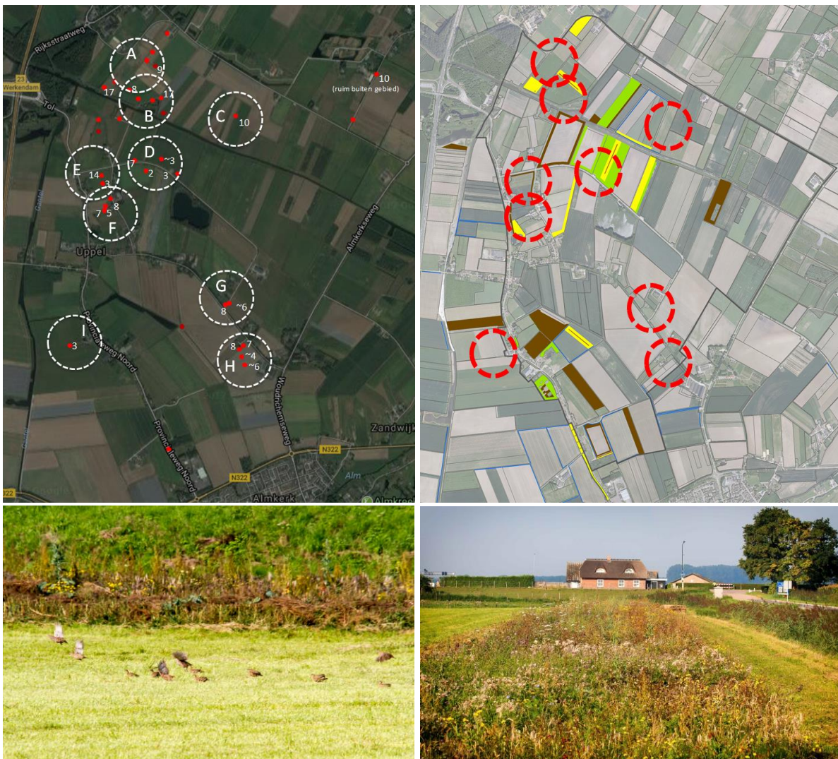
Met de klok mee vanaf linksboven: Klustering van waarnemingen tot verschillende kluchten, ligging biotoopverbeterende maatregelen, klucht E met 12 jongen en bloemrijke rand in leefgebied groep E.

In de Oude Doorn is te zien dat de meeste succesvolle broedgevallen zitten in de omgeving waar maatregelen zijn geconcentreerd (zie kaartje en foto's hieronder). In het najaar zal blijken of deze akkerranden, keverbanken en bloemenblokken hebben bijgedragen aan een betere overleving van de 'chicks'.