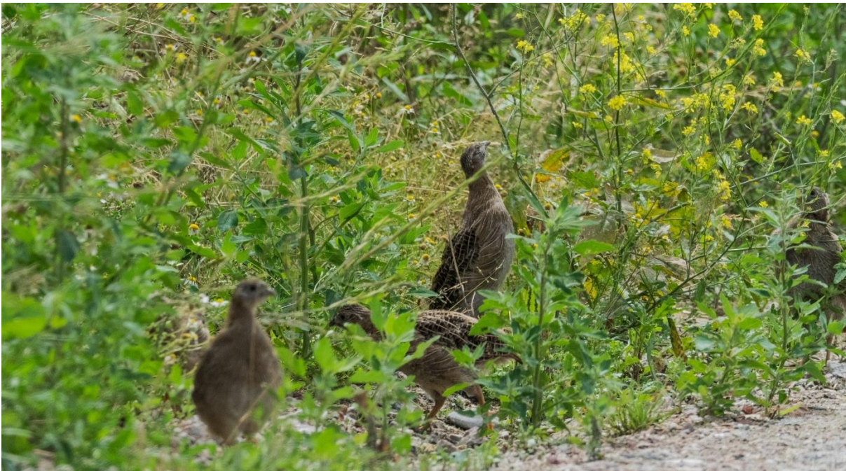
Jonge patrijzen hebben een uitstekende schutkleur als ze op zoek zijn naar insecten en jonge blaadjes.

De maanden mei t/m juli zijn altijd onzekere maanden voor iedereen die zich bezig houdt met het beschermen van de patrijs. De schuwe vogels laten zich dan amper zien, omdat ze zitten te broeden óf met hun kuikens de dekking opzoeken (zie foto hieronder). Je vraagt je af: “Waar zijn ze toch gebleven?!”. Maar, nu op veel plaatsen de graanakkers geoogst zijn, worden de ‘Greys’ (Engelse naam is Grey Partridge) weer zichtbaar. Partridge-deelnemers melden kluchten (groepjes van meerdere patrijzen) op hun land of op rijpaden tijdens werkzaamheden. Vogelaars spotten groepjes tijdens wandelingen of fietstochten op en langs de weg en omwonenden melden ze soms zelfs in de achtertuin. Vooral waarnemingen van groepjes volwassen vogels met jongen zijn daarbij belangrijk. Doordat deze gegevens allemaal ingevoerd worden op Waarneming.nl , kunnen we voor het eerst de balans opmaken.